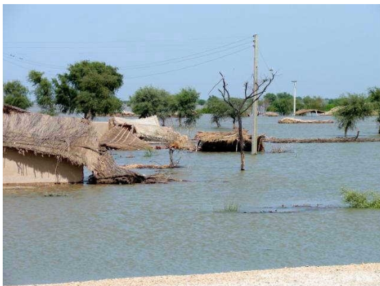
Zones inondées à Hyderabad - Dadu -