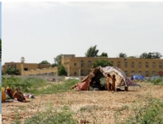
Camp de fortune de personnes déplacées à l'intérieur du pays