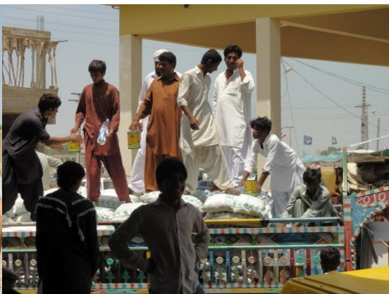
Distribution de nourriture