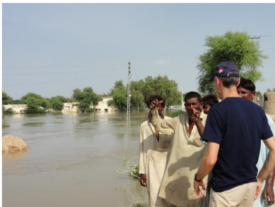
Entretiens avec les autorités locales pour évaluer la situation